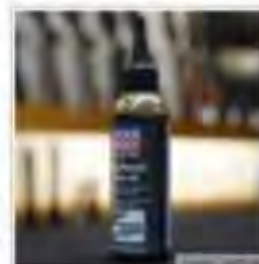
The viscous gun oil from Liqui Moly offers high corrosion protection.

In addition, Gun Oil can also be used to care for the wooden stock very effectively. For sturdy polymer stocks, cold clear water is enough to remove contamination. Editor's tip for cleaning polymer stocks: if necessary, use a small nail brush, moisten it with a little water and use it to remove dirt residue from the stock. The advantage of the nail brush is that you can also get into the small pores and thus quickly give the stock its necessary cleaning and care.