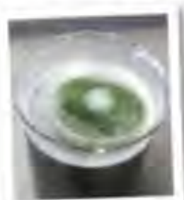
Filter element in the Motorbike Foam Filter Foam

Important: Do not under any circumstances wring the filter out, as this could cause damage!