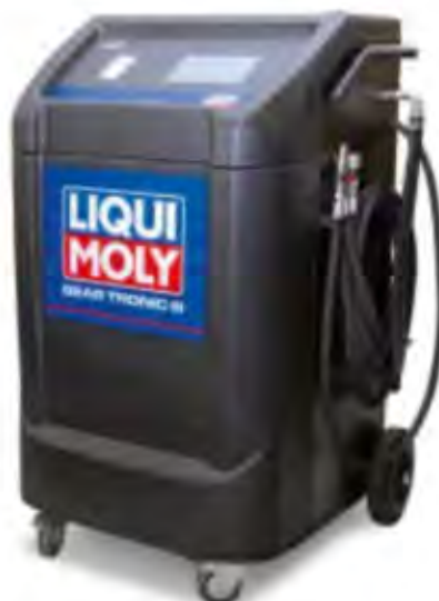
De nieuwe Gear Tronic III van LIQUI MOLY