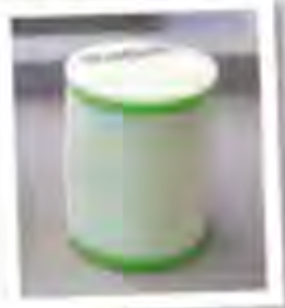
Air filter after cleaning with Motorbike Foam Filter Cleaner

Note: Wear suitable gloves (e.g. disposable gloves) when using the article.