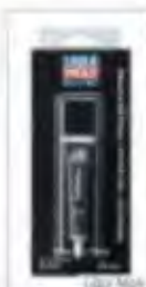
Just like the oil, the gun grease from Liqui Moly can be used on all moving parts of the gun.

The second product that no gun cabinet should be without is the Gun Care Spray from the Guntec series. When using it, make sure to use it only in well-ventilated rooms. Please do not inhale the gas/fume/vapor/aerosol gases of the product, otherwise direct contact may cause skin irritation. So much for user protection. The product lubricates, preserves and protects, so that even an old rifle is relatively quickly brought back to shine. Unlike the oil, you can use the spray on a very good penetrating effect and thus reach even difficult and hidden places. Before use, please always shake the gun spray can well. All parts that are to be coated with the spray must first be cleaned of old oil residues.