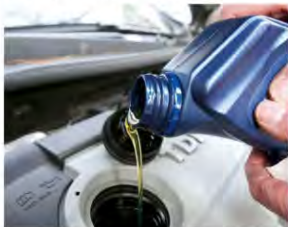
Die Lage auf den Rohstoffmärkten hat Auswirkungen auf die Geschäfte der Ölkonzerne