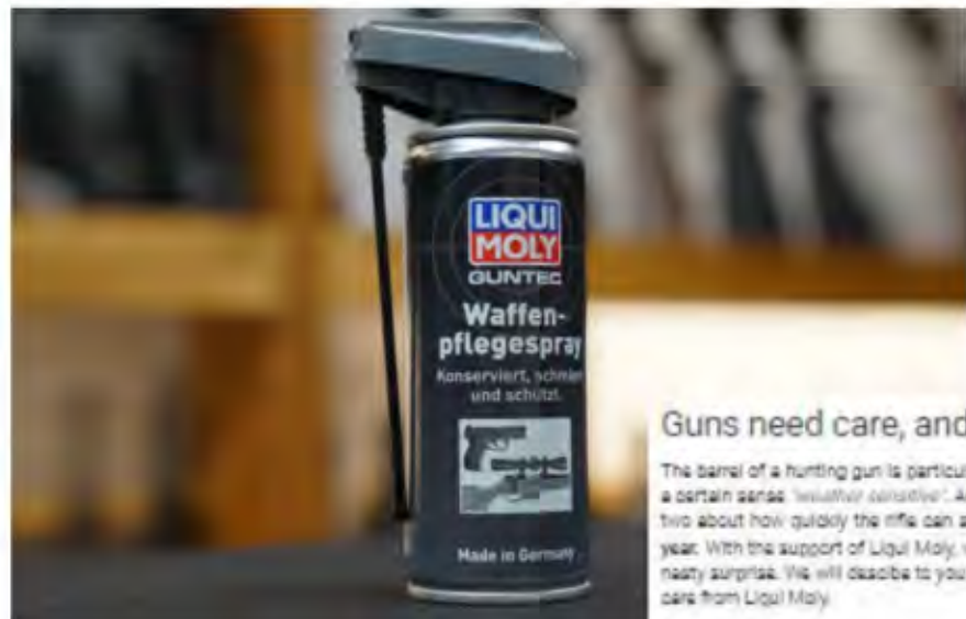
The Liqui Moly Guntec products – in addition to the gun care spray (see above) the series also offers a gun oil and