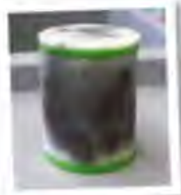
Contaminated air filter