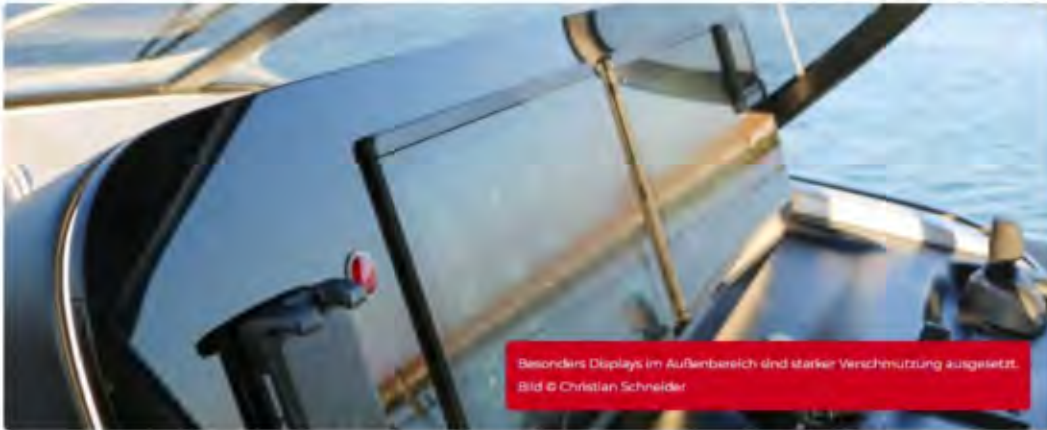
Besonders Displays im Außenbereich sind starker Verschmutzung ausgesetzt.