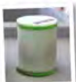
Air filter with dirt residues

Note: Oil residues remaining in the air filter is normal, even desired! The air filter should only be cleaned of dirt and dust.